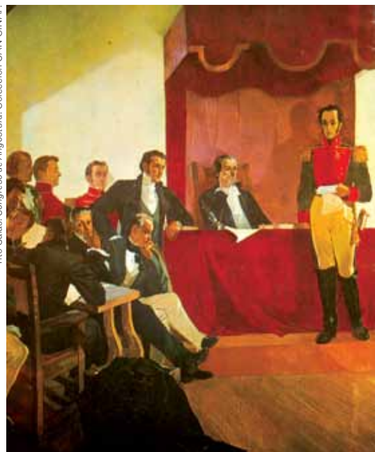
Tito Salas. Congreso de Angostura. Colección GAN-CINAP.

> Simón Bolívar, Discurso de Angostura , 15 de febrero de 1819.